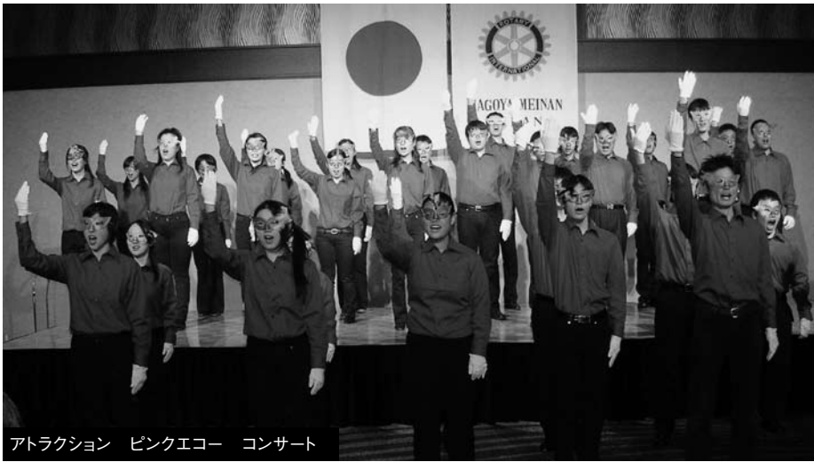
アトラクション ピンクエコー コンサート